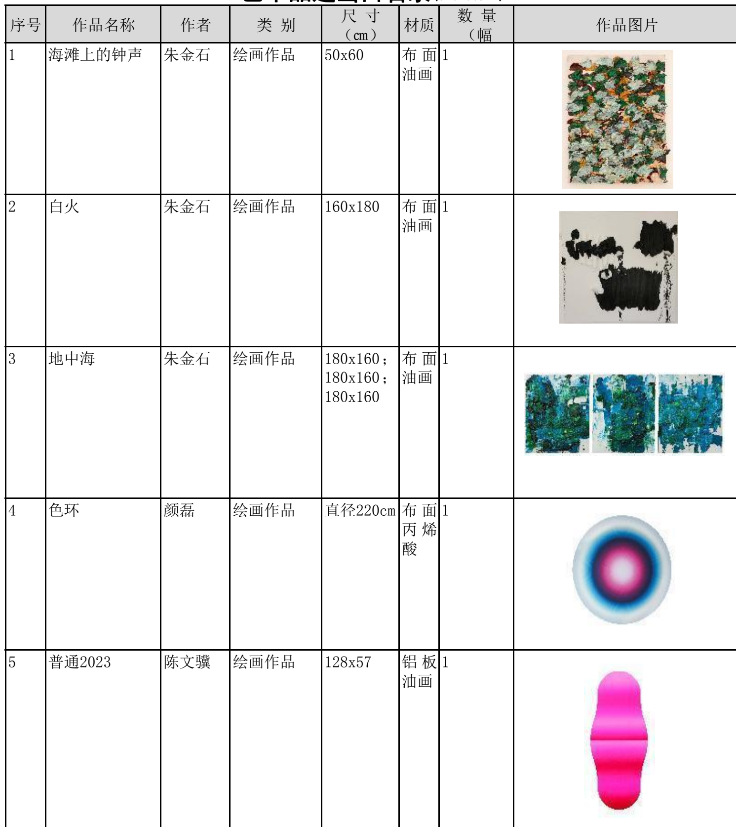
艺术品进出口名录 (V20230912)